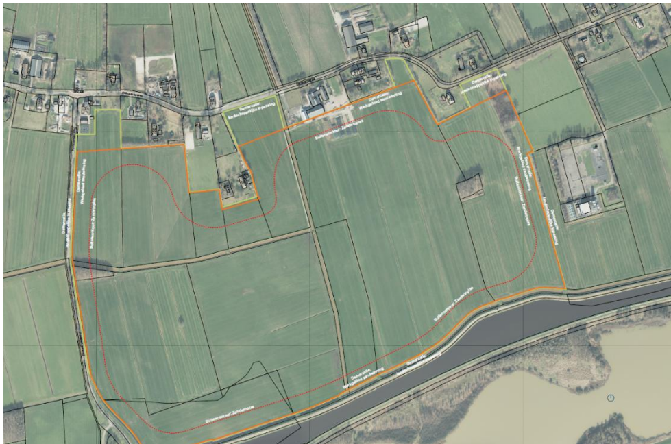
Figuur 2.1 Plangebied zandwinning inclusief contour van de waterplas

Onderstaande figuur geeft het plangebied weer (gele contour), inclusief de contour van de waterplas (rode contour). Voor de op- en overslag van het gewonnen zand wordt gebruik gemaakt van het depot van de bestaande zandwinning en daarbij behorende infrastructuur voor het transport van het zand. Onderdeel van de voorgenomen activiteit is de herinrichting van het gebied c.q. landschappelijke inpassing van het plan. Op grond van de ontgrondingsbepalingen opgenomen in de Omgevingswet, moet bij de aanvraag voor een omgevingsvergunning inzicht worden in de inrichting van het gebied en de landschappelijke inpassing van het voornemen. De wijze waarop dit wordt gedaan is beschreven in paragraaf 2.4.