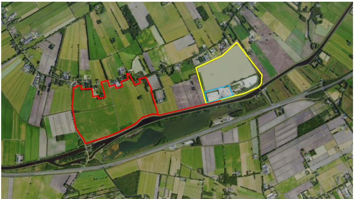
Figuur 1.1: Plangebied Zandwinning Echten

VOF Zandexploitatie maatschappij Echten is voornemens nabij de bestaande zandwinning aan de Willem Moesweg in Veeningen in gemeente De Wolden een nieuwe zandwinning te realiseren ten zuiden van de Oshaarseweg. De bestaande zandwinning is met een gele contour weergegeven in figuur 1.1, waarbij de ligging van het bestaande depot / de bestaande installatie met een blauwe contour is weergegeven. De nieuwe zandwinning met de buisleiding is indicatief met een rode contour aangeduid. De nieuwe zandwinning is circa 65 ha groot (plangebied).