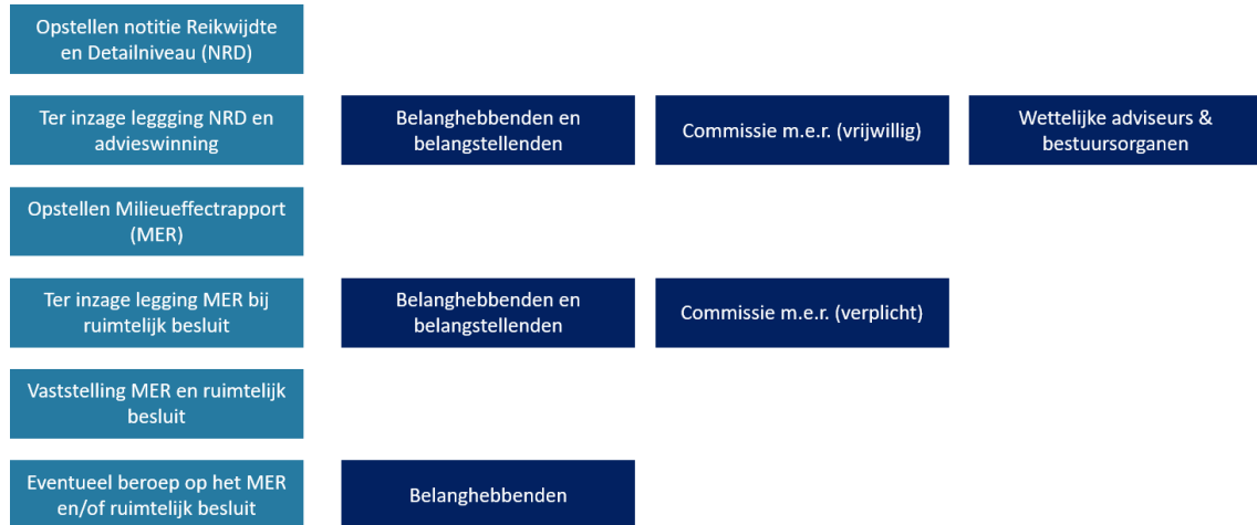
Figuur 1.1: Stappenplan van de mer-procedure

De mer-procedure heeft enkele stappen, waarvan het opstellen van de Notitie Reikwijdte en Detailniveau (NRD) de eerste stap is. Hierna volgt de participatiestap, waarbij de NRD ter inzage wordt gelegd tijdens een periode van zes weken, zie onderstaand figuur.