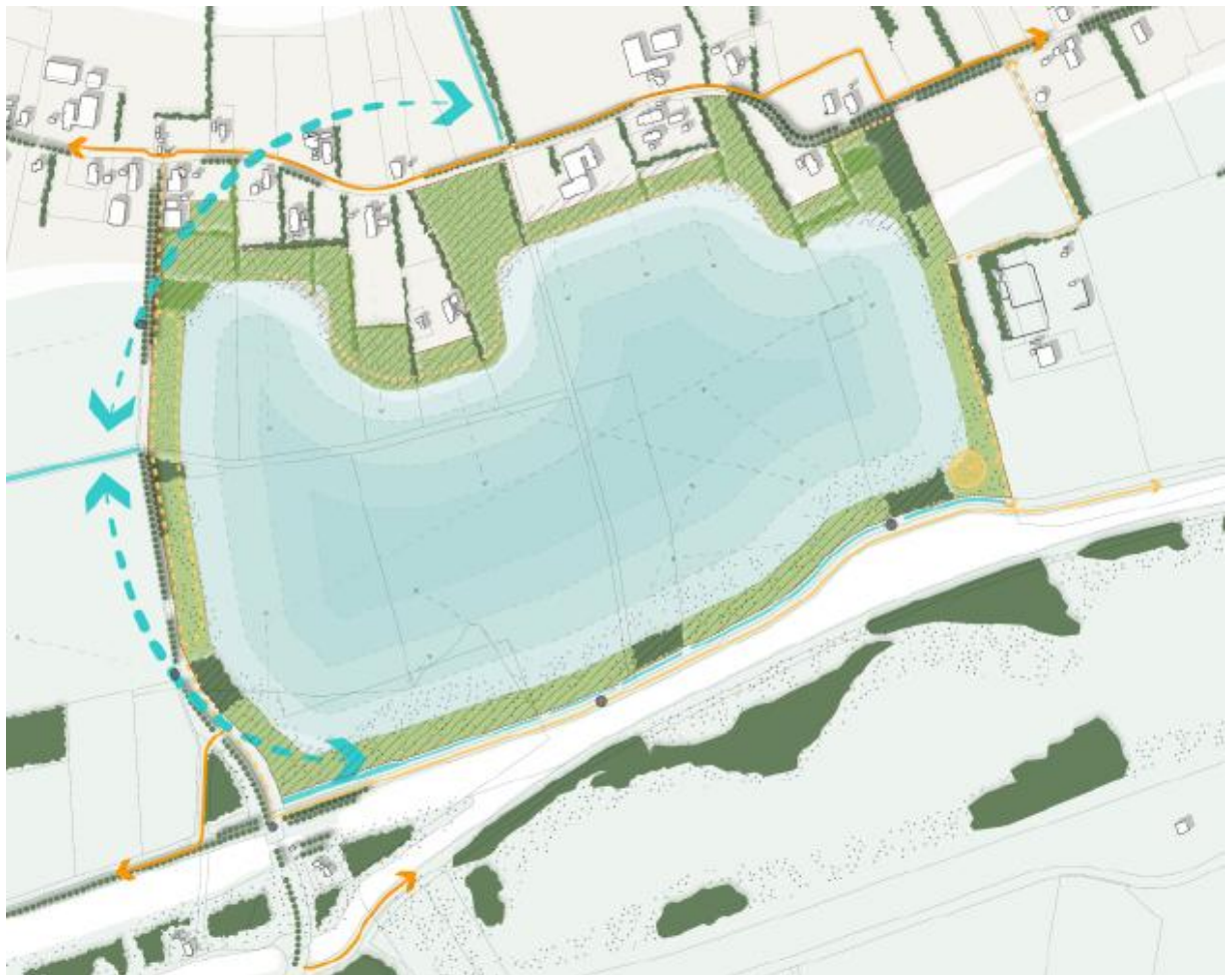
Figuur 2.3 Concept landschappelijke inpassing

Vanuit een landschappelijke analyse en de wensen van diverse partijen en omwonenden wordt rekening gehouden met verschillende zonering en uitgangspunten. Centraal in het landschapsplan staan: