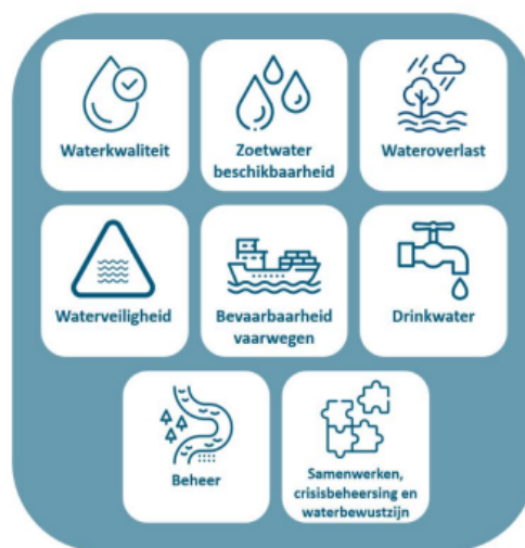
Figuur 1: de wateropgaven die bijeenkomen in het NWP

De samenstelling en de werkwijze van de werkgroep van de Commissie en verdere projectgegevens staan in bijlage 1 van dit advies. De projectstukken die bij het advies zijn gebruikt staan op de website. Deze zijn te vinden door nummer 3979 op www.commissiemer.nl in te vullen in het zoekvak.