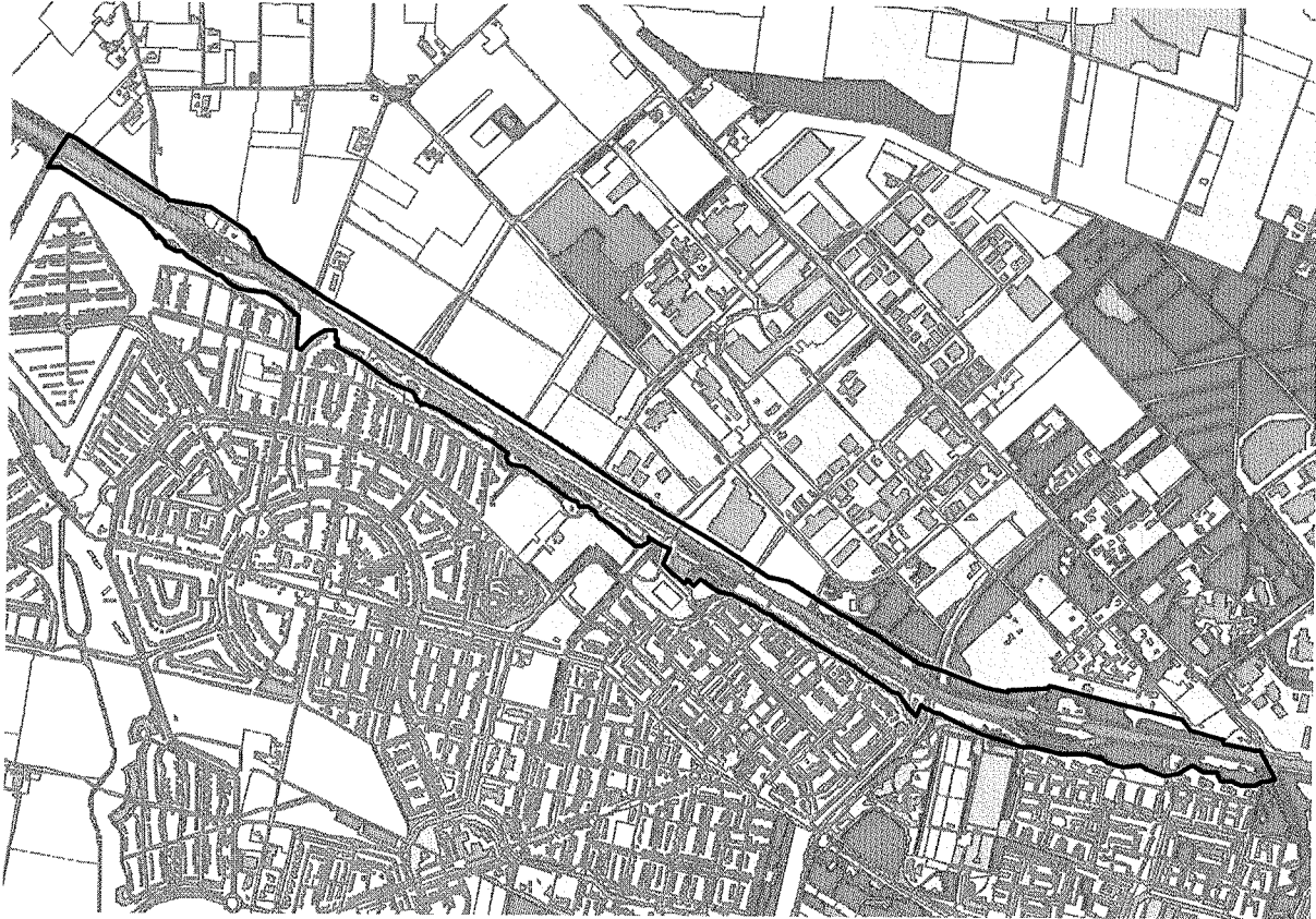
Kaart 1: begrenzing onderzoeksgebied.

Het voornemen is om het Wilhelminakanaal te verbreden tussen de Dongenseweg en de Donge. In april 2008 is door de gemeente Tilburg aan het Ecologisch Adviesbureau Cools de opdracht verleend om een gedetailleerd onderzoek uit te voeren naar beschermde en bedreigde planten- en diersoorten in het gebied zoals weergegeven op kaart 1. De resultaten van dit onderzoek zijn in januari 2009 vastgelegd in het rapport: Ecologisch onderzoek verbreding Wilhelminakanaal te Tilburg. In het voor u liggende rapport zijn de onderzoeksresultaten getoetst aan de Flora- en faunawet.