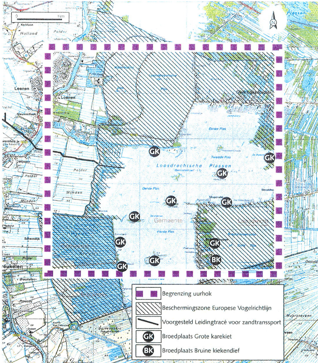
figuur 4.4: Leidingtracé, Vogelrichtlijngebied en locaties gevoelige vogelsoorten