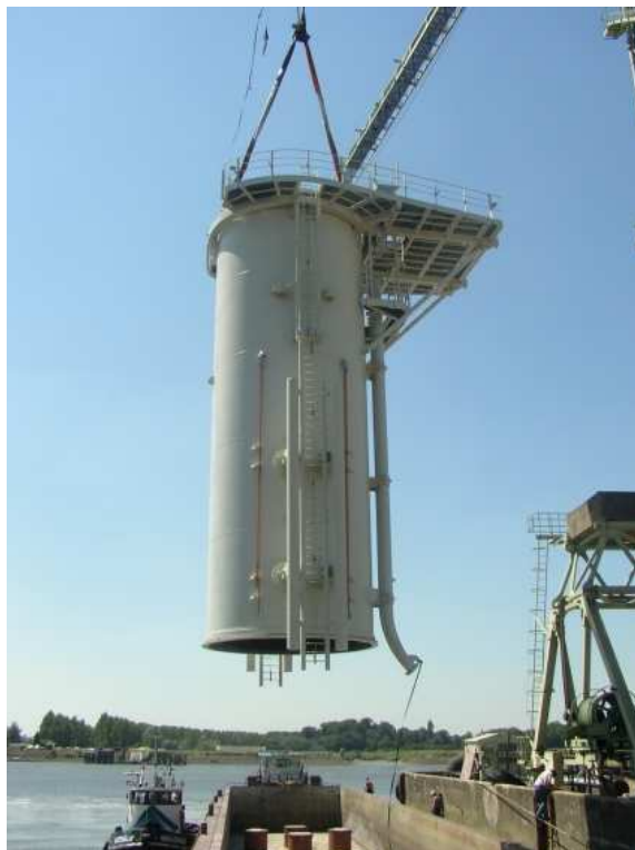
Transitiedeel offshore windturbine (voorbeeld)

Nadat de hefiactiviteiten voltooid zijn, wordt met de kraan het transitiedeel op de funderingspaal geplaatst. Het transitiedeel wordt zodanig uitgericht, dat de flens voor de bevestiging van de windturbinemast in het horizontale vlak ligt. Vervolgens wordt het transitiedeel gefixeerd op de funderingspaal en worden de J-tubes voor de middenspanningskabels gemonteerd.