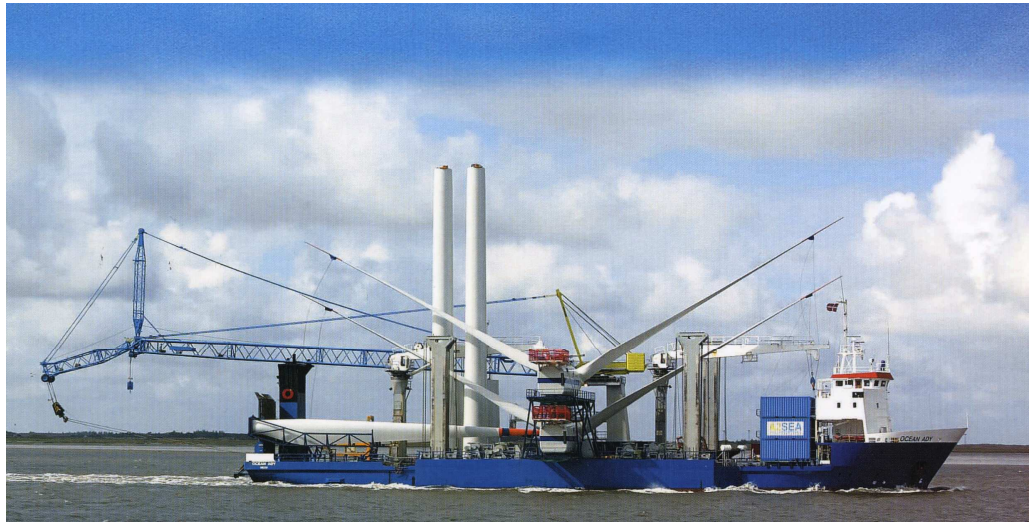
Hefschip voor offshore installatie (voorbeeld)