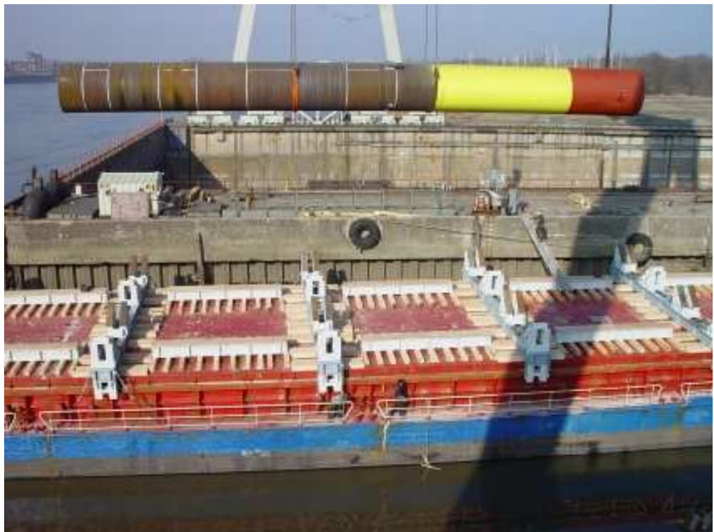
Laden van een funderingspaal op een transportschip (voorbeeld)

Zowel de turbines als de funderingspalen worden aangevoerd naar een bouwplaats gelegen in een havengebied, zoals bijvoorbeeld in Rotterdam, IJmuiden of Den Helder.