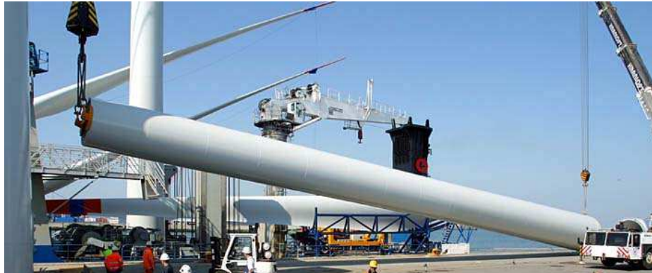
Laden windturbinemast (voorbeeld)

De windturbinemasten en de gondels met de nog tweebladige rotor worden bij de bouwplaats op het installatieschip geplaatst. Er kunnen meerdere masten en gondels gelijktijdig op het schip worden geladen. Het schip vaart naar de offshore bouwlocatie en wordt respectievelijk met ankers en het jack-up systeem gefixeerd naast de funderingspaal.