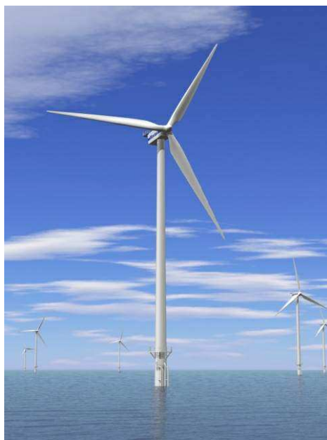
Geplaatste windturbine (voorbeeld)