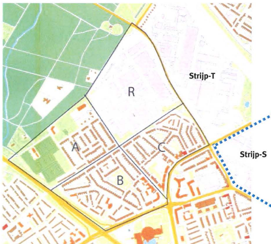
Figuur 2.2: Deelgebieden A, B en C in Drents Dorp en Strijp R (deelgebied R)

In Strijp R (figuur 2.2) verdwijnt de bedrijvenfunctie en worden maximaal 550 woningen gebouwd, grotendeels grondgebonden woningen passend in de visie van 'groenstedelijk wonen'.