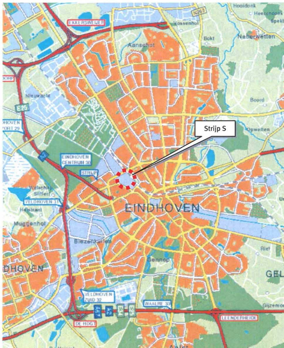
Figuur 1.1: Ligging Strijp S

gekozen aanpak zal worden voorgezet, tenzij uit de analyse nu blijkt dat een andere aanpak noodzakelijk is.